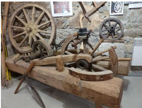
Der Radbock des Wagners

13.00 - 17.00 Uhr: Vielfältiges Programm für Jung und Älter: Holzbrettspiele - Kegeln - Waldquiz - Puzzle Wettbewerb - Simulationsspiel: Pflanze und pflege deinen Wald u.a.m.